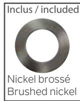
Nickel brosse / Brushed nickel

Câble de connexion de 12" (305mm) 12" (305mm) Connecting cable