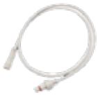
PLG-RSL-24 Câble d'extension de 24" 24" Extension cable