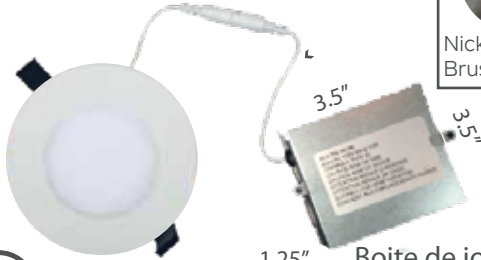
1.25" Boîte de jonction / Junction box

Câble de connexion de 12" (305mm) 12" (305mm) Connecting cable